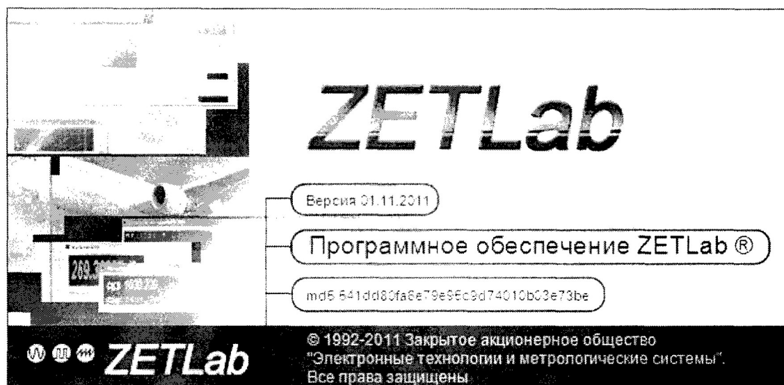
Идентификационные данные программного обеспечения «ZETLab»

7.9.2 Для проверки соответствия запустить ПО «ZETLab» и проверить на экране монитора идентификационные данные программного обеспечения, которые представлены на рисунке 7.2.